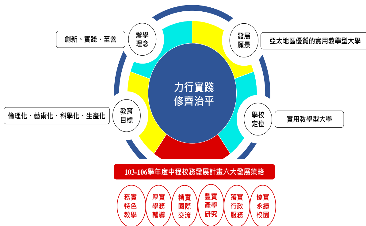
【圖 2】：本校教育目標、定位及發展願景與 103-106 學年度中程校務發展計畫關係圖

本校衡諸現今高等教育環境與國內產經環境之變化趨勢及本身過去厚實之基礎與條件，並於「力行實踐，修齊治平」校訓、「創新、實踐、至善」辦學理念、「實用教學型大學」自我定位，及期成為「亞太地區優質的實用教學型大學」發展願景之指引下，具體且周延地訂定以六大發展策略（即：務實特色教學、厚實學務輔導、精實國際交流、豐實產學研究、落實行政服務、優實永續校園）為主軸之本期程(103-106 學年)之中程校務發展計畫，計有六大發展策略與 38 項分項計畫，以提升本校之辦學品質及達成本校教育目標所要培養學生之基本素養與核心能力，並朝成為「亞太地區優質的實用教學型大學」之發展願景邁進。有關本校校訓、辦學理念、教育目標、學校定位及發展願景與 103 至 106 學年度中程校務發展計畫六大發展策略之關係，參見【圖 2】。