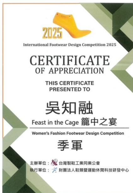
▲服經系吳知融同學榮獲 2025 國際鞋樣創意設計競賽流行女鞋組