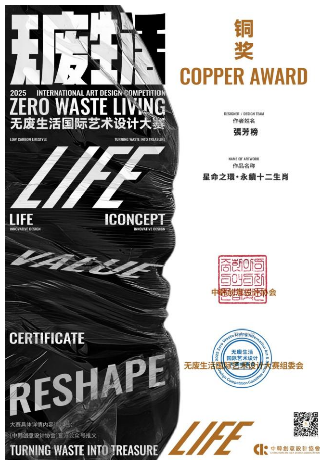
▲時尚系張芳榜助理教授入選 2025 南京國際和平海報雙年展並獲優秀獎