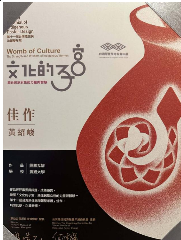
▲ 時尚系黃紹峻同學參加 2025 第十一屆台灣原住民海報雙年展競賽，榮獲佳作

本次活動共有高中職 7 所，大專院校 25 所參加，另有社會組參賽，總計 509 件作品，黃紹峻同學榮獲佳作(2025.10.21)