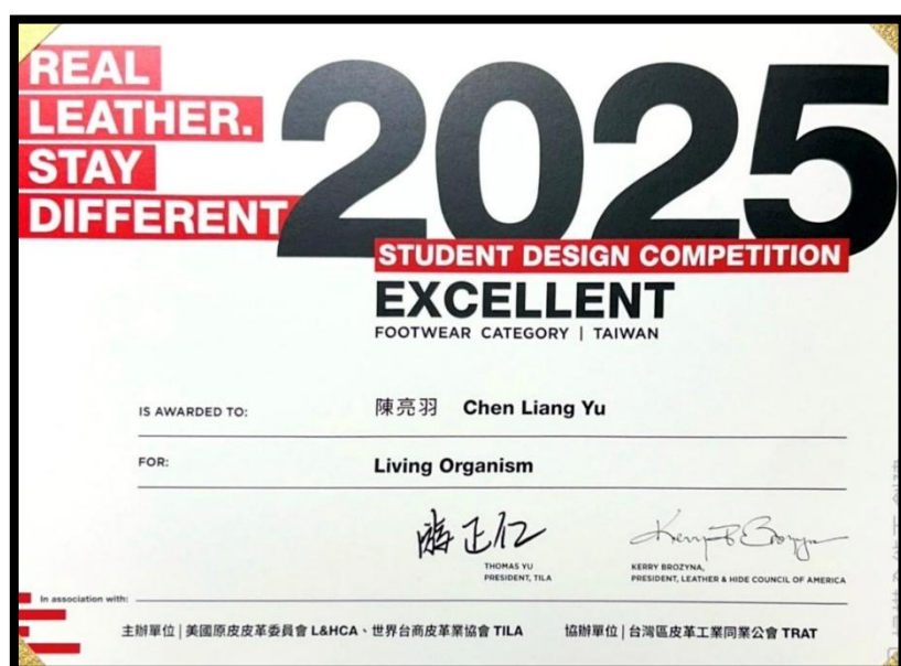
▲ 服經系陳亮宇同學榮獲2025第六屆世界皮革創意設計大賽 鞋類設計組優選獎

服飾設計與經營學系學生繼 2020~2024 連續五年榮獲多項大獎，2025 年陳亮羽同學榮獲鞋類設計組優選獎。(2025.8.30)